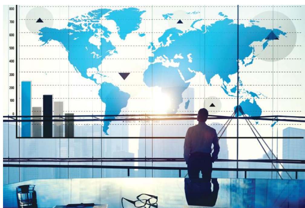
Minden cégre hatással van a koronavírus világjárvány, változnak a kilátások is

A járvány sajnos már több mint egy éve befolyásolja negatívan az életünket. Cégünk termékköréből adódóan szerencsésnek mondhatja magát, állateledel, illetve fapellet gyártó gépek kopó alkatrészeit (szerszámait) gyártjuk, melyekre folyamatos az igény, 95 %-ban exportra gyártunk. 2020-ban jelentős kapacitásbővítést hajtottunk végre, rendelésállományunk is emelkedett. Viszont a januári szokásos csendesebb időszak idén elhúzódni látszik, kevesebb megrendelés érkezik. Új partnerek keresésében örömmel vesszük a Kamara online exportfejlesztési programsorozatát, ahol lényeges piaci információkhoz juthatunk az adott ország gazdaságára vonatkozóan a helyi kereskedelmi képviselők beszámolója alapján. Külpiazi mentorként kamarai online rendezvényeken mi is továbbadjuk az export üzletek lebonyolításában szer-