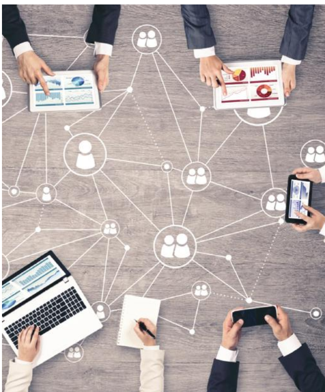
Várjuk a duális képzőhelyek jelentkezését programunkra

A program az Innovációs és Technológiai Minisztérium NFA-KA-ITM-9/2020/TK/07 számú szerződés támogatásával valósul meg.