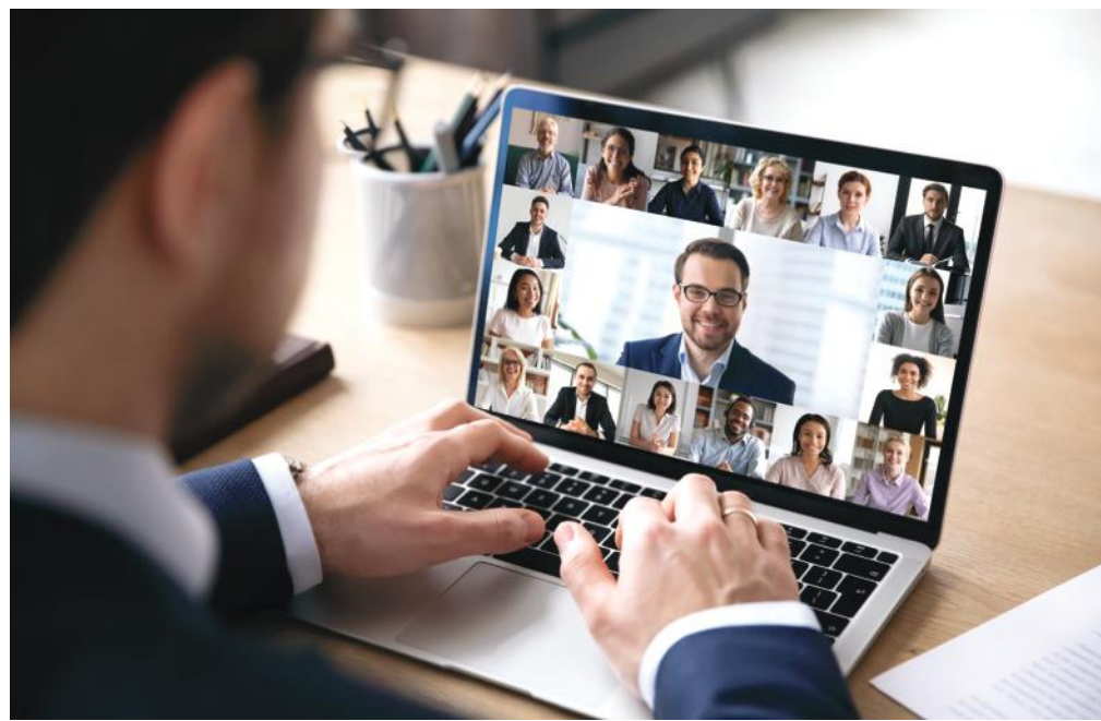
Különböző iparágak képviselőinek kínál online üzleti programokat a Gazdaság Házában működő EEN iroda

Részvételi feltételek, további részletek és jelentkezés: Buda Csilla, 22/510-316, csilla.buda@fmkik.hu, www.fmkik.hu