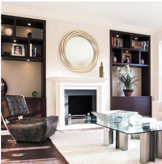
Az AIKSZ Zrt.-nél az egyedi bútorgyártás mesterfogásait sajátíthatják el a tanulók

Mint mondta, a gyakorlati képzés rendkívüli kihívásokkal küzd napjainkban. Egy óriási demográfiai gödör aljáról próbálják felküzdeni magukat. A gyerek kevés, a szakmunkás utánpótlás még kevesebb. A szakma, a kétke-